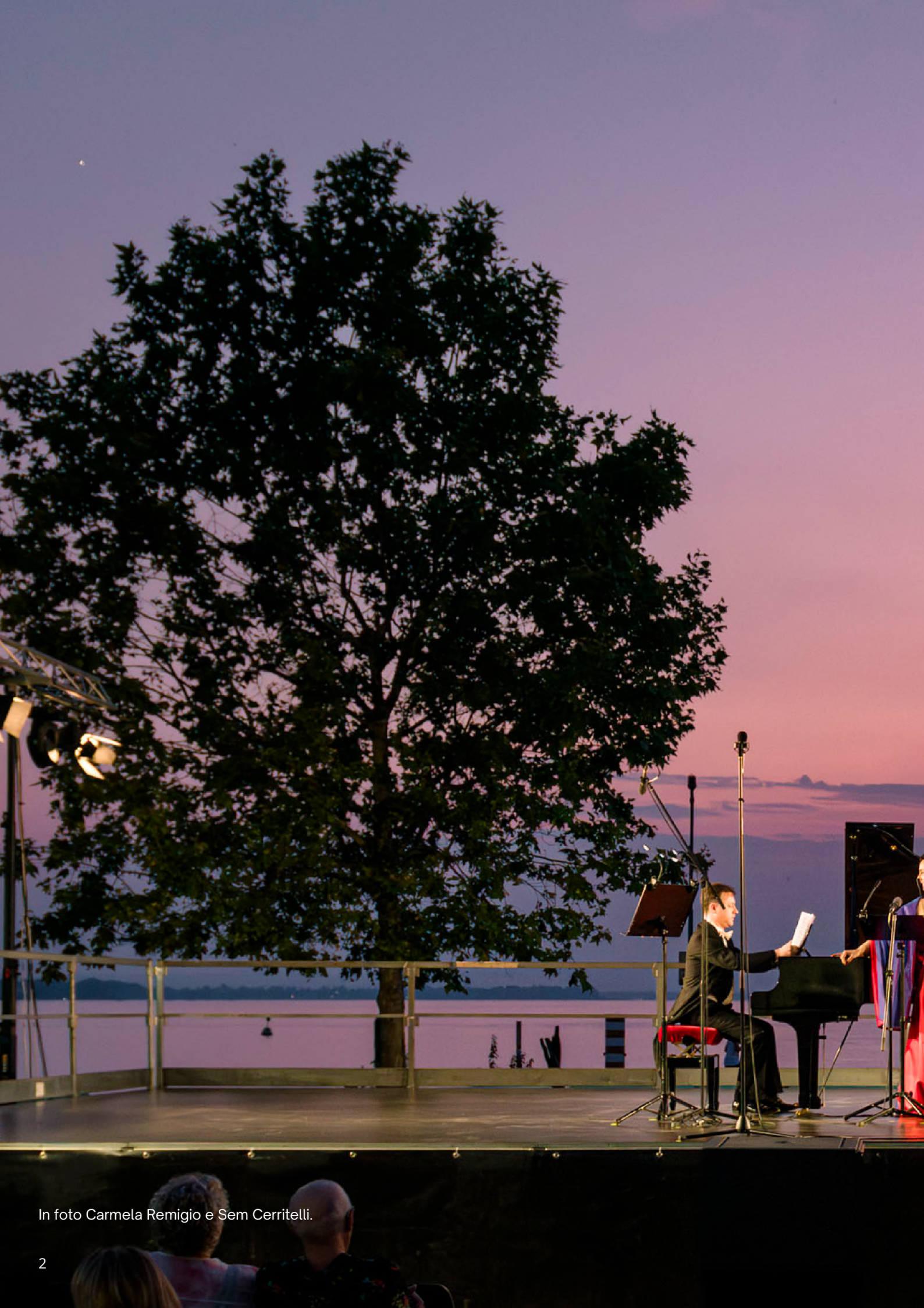
In foto Carmela Remigio e Sem Cerritelli.