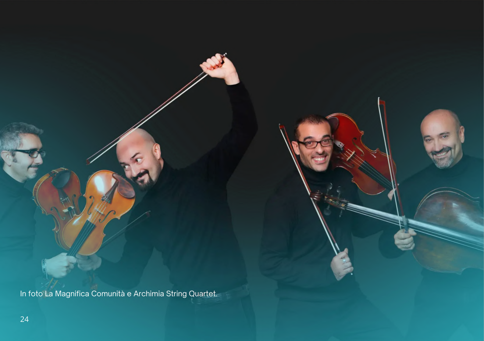
In foto La Magnifica Comunità e Archimia String Quartet.